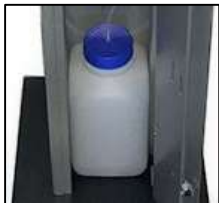
Behälter einfach austauschen