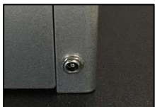
Anschluß für Akkuladung