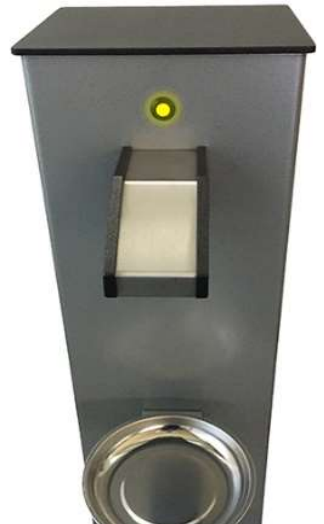
Tropfschale aus Edelstahl