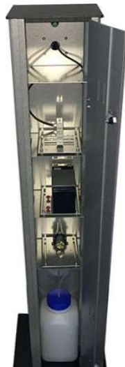
LED-Anzeige für Füllstand und Ladezustand des Akkus