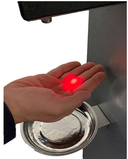
Sensor-Lichtpunkt führt die Hand an die richtige Stelle